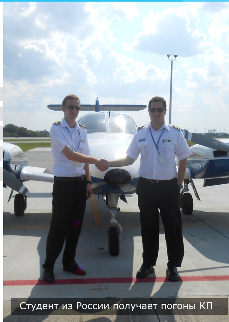
Студент из России получает погоны КП

Помимо учебы, студенты погружаются в плотную